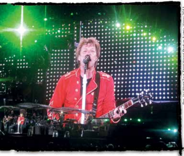
Bon Jovi: World Tour, Ernst Heppel Stadium, Austria, Vienna 2011

Ich werde in der Sackgasse des Lebens nur noch älter.