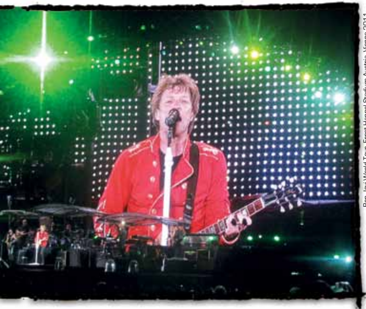
Bon Jovi: World Tour, Ernst Heppel Stadium, Austria, Vienna 2011

Ich werde in der Sackgasse des Lebens nur noch älter.