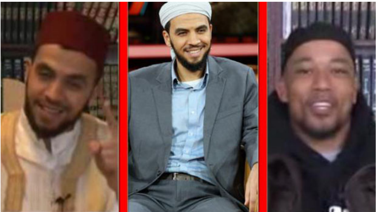
Die „Weisheiten“ des Imam „Ihr dürft Frauen schlagen“

Die Bibel sagt dagegen, dass Jesus Christus wiederkommen wird in die Hauptstadt der Juden nach Jerusalem und die Stadt durch das heute noch zugemauerte Osttor betreten wird.